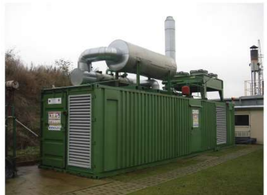
Instalación para la obtención de energía