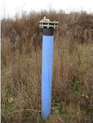
Campana de pozo

Además de una fácil instalación y la posibilidad de lectura directa de caudal, representa una opción muy económica y mantiene una precisión lo suficientemente buena para los requisitos de la aplicación.