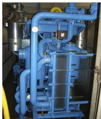
Motor de cogeneración